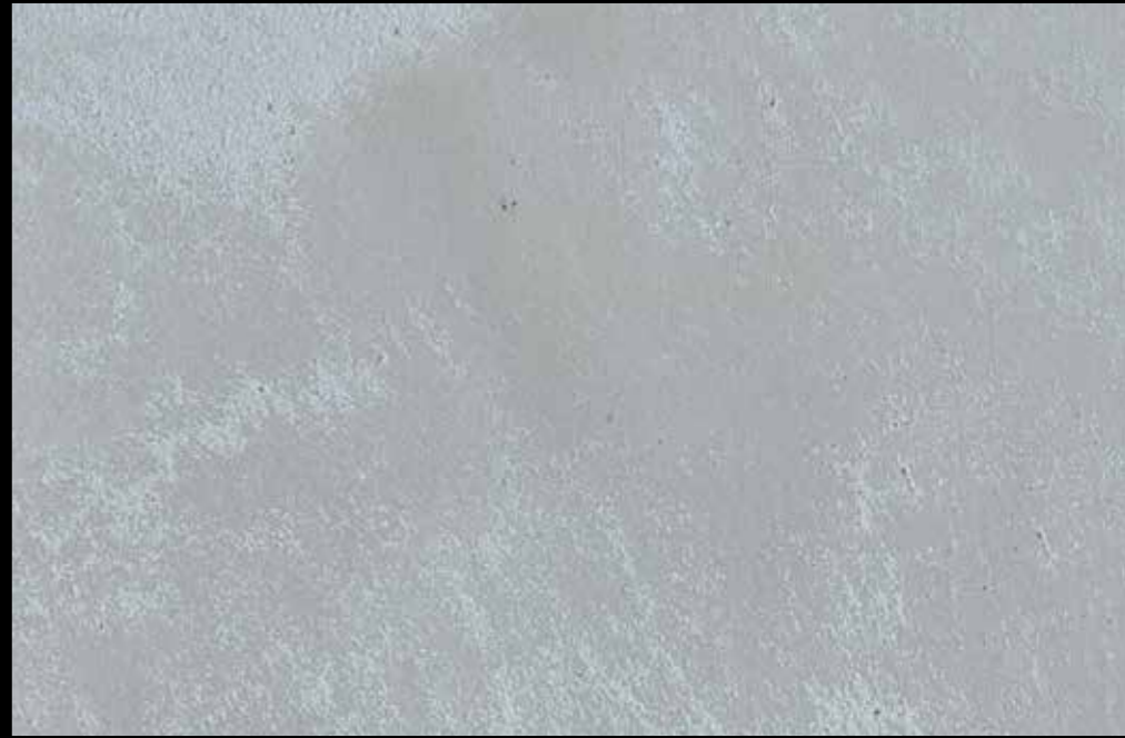
Rif. 10 NAUTILUS (LT. 1) + COLORI' Col. 448 C (2 ML.) MAVERICKS (LT. 0,500) + L50 Col. 304 (LT. 0,100) MAVERICKS (LT. 0,500) + L50 Col. 307 (LT. 0,100)