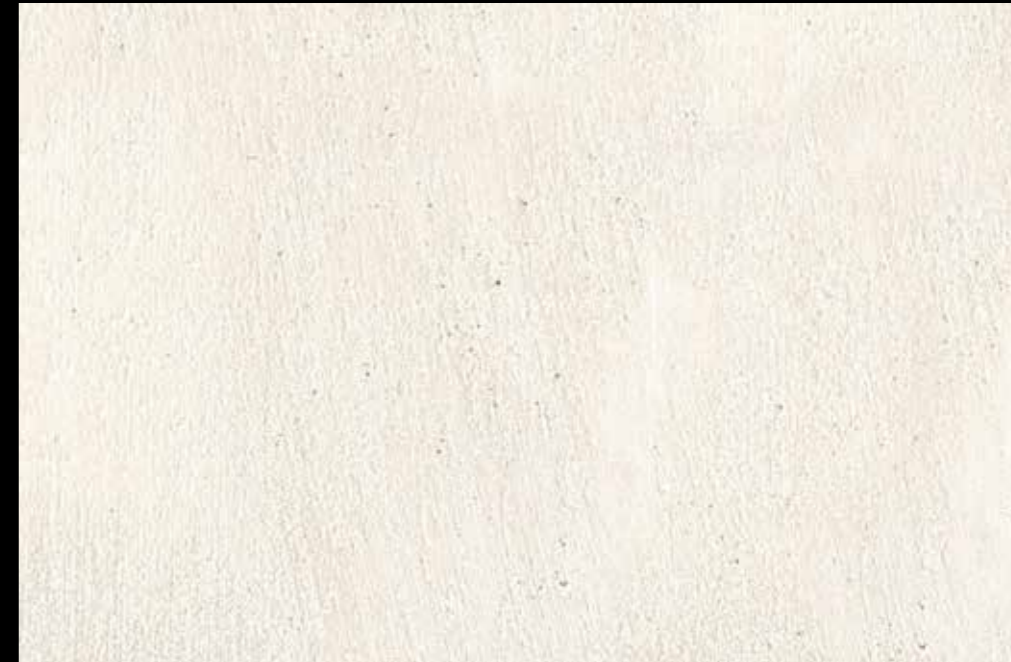
Rif. 16 NAUTILUS (LT. 1) MAVERICKS (LT. 0,500) + L50 Col. 302 (LT. 0,100) MAVERICKS (LT. 0,500) + L50 Col. 307 (LT. 0,100)