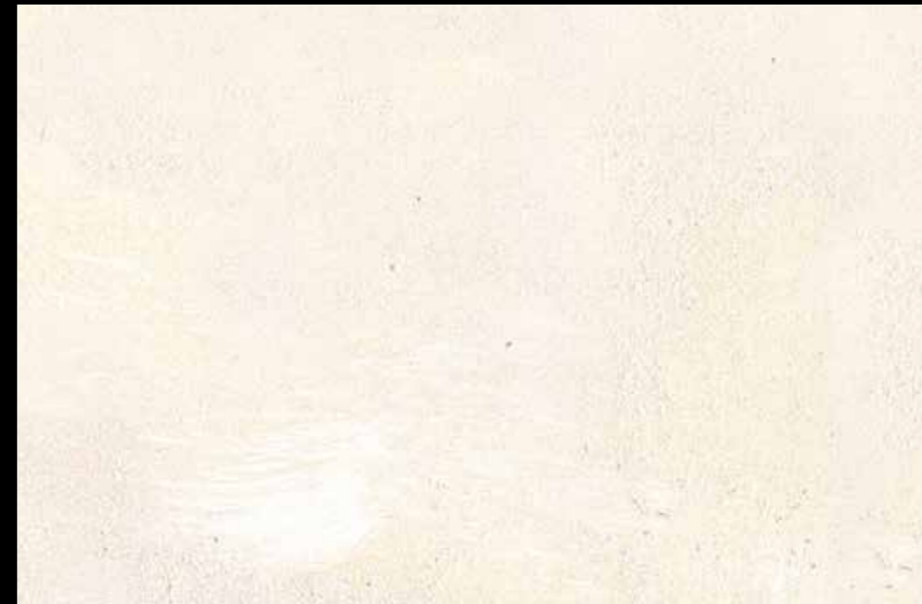
Rif. 19 NAUTILUS (LT. 1) MAVERICKS (LT. 0,500) + L50 Col. 304 (LT. 0,100) MAVERICKS (LT. 0,500) + L50 Col. 307 (LT. 0,100)