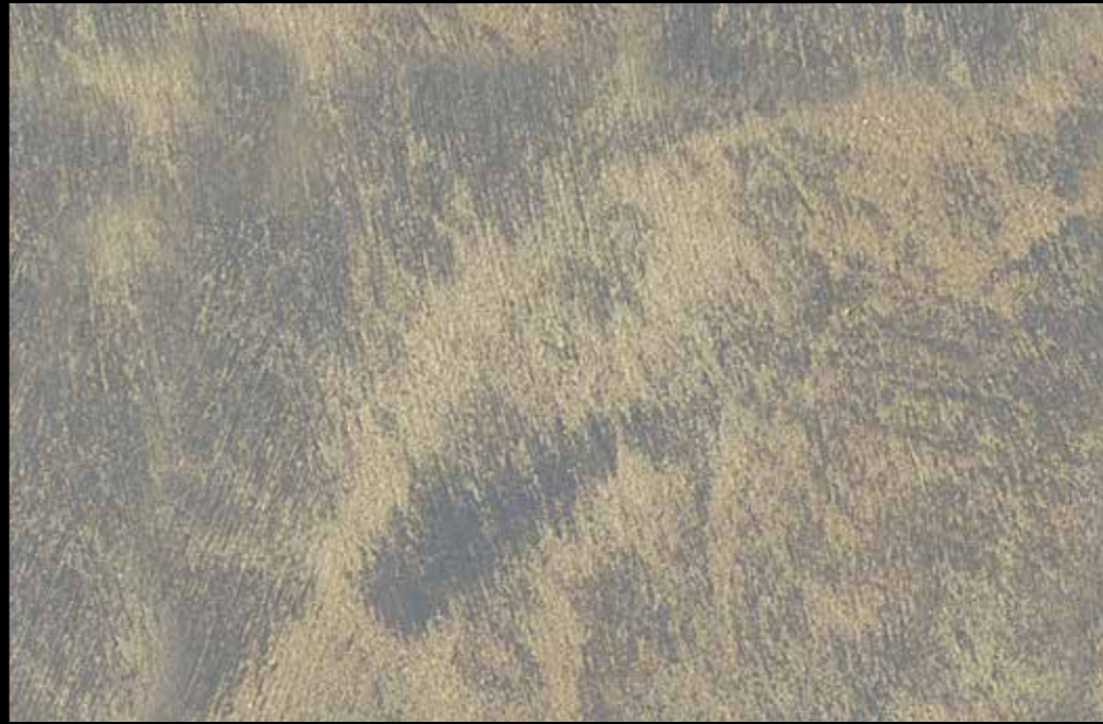
Rif. 12 NAUTILUS (LT. 1) + COLORI' Col. 448 B (10 ML.) MAVERICKS (LT. 0,500) + L50 Col. 305 (LT. 0,100) MAVERICKS (LT. 0,500) + L50 Col. 308 (LT. 0,100)