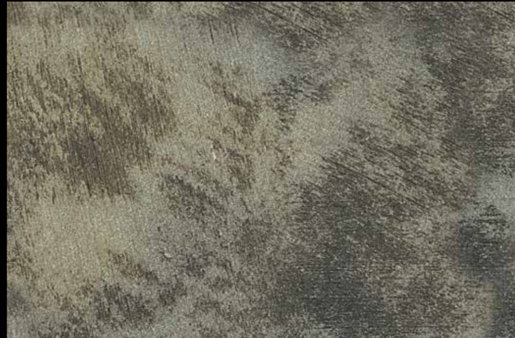
Rif. 17 NAUTILUS (LT. 1) + COLORI' Col. 451 A (80 ML.) MAVERICKS (LT. 0,500) + L50 Col. 301 (LT. 0,100) MAVERICKS (LT. 0,500) + L50 Col. 305 (LT. 0,100)