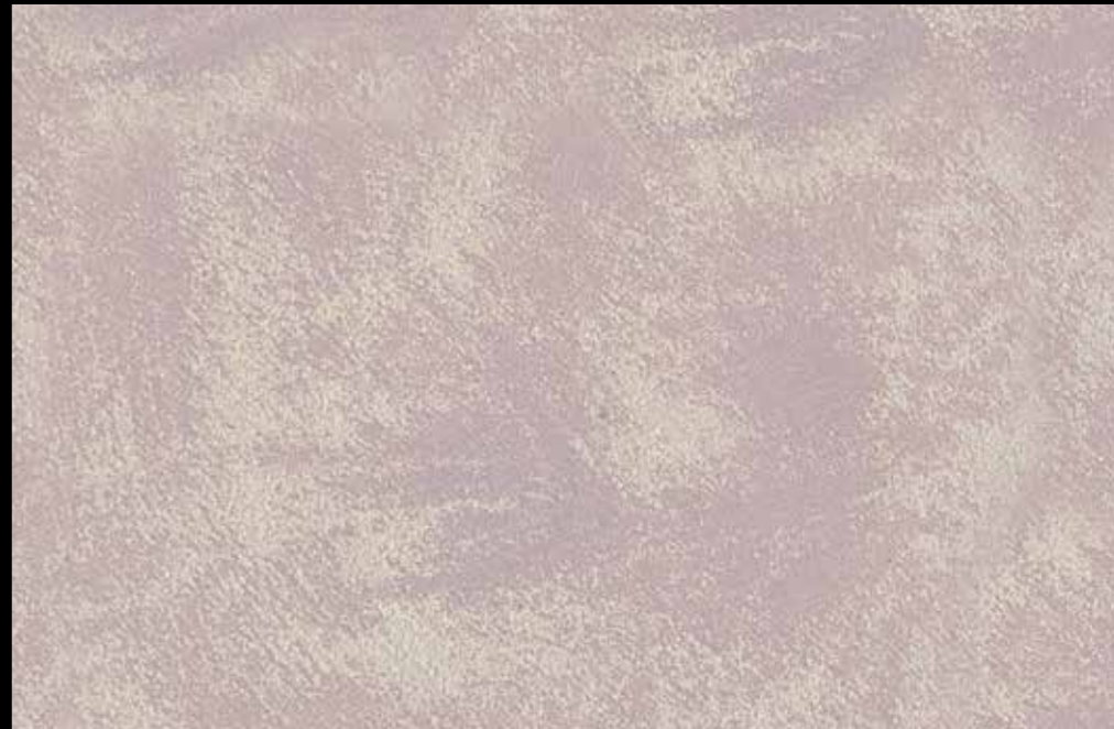
Rif. 11 NAUTILUS (LT. 1) + COLORI' Col. 472 C (2 ML.) MAVERICKS (LT. 0,500) + L50 Col. 304 (LT. 0,100) MAVERICKS (LT. 0,500) + L50 Col. 305 (LT. 0,100)