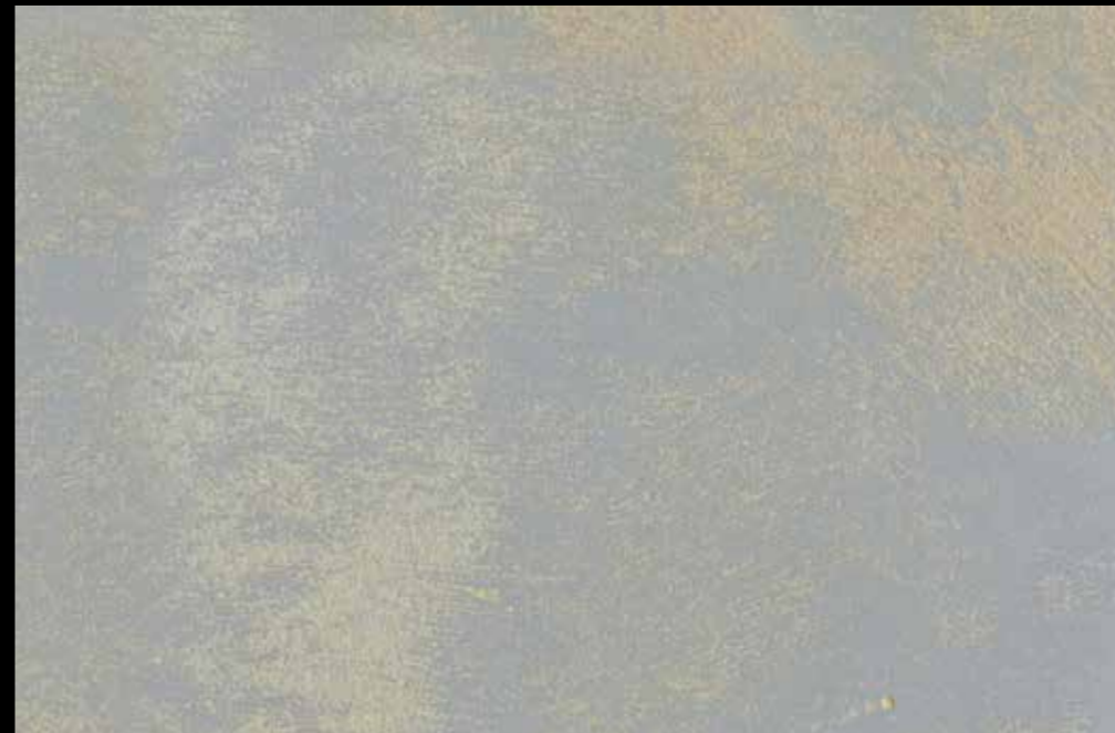
Rif. 18 NAUTILUS (LT. 1) + COLORI' Col. 448 C (2 ML.) MAVERICKS (LT. 0,500) + L50 Col. 304 (LT. 0,100) MAVERICKS (LT. 0,500) + L50 Col. 308 (LT. 0,100)