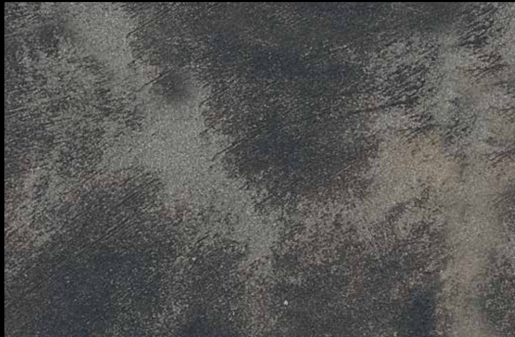
Rif. 13 NAUTILUS (LT. 1) + COLORI' Col. 451 A (80 ML.) MAVERICKS (LT. 0,500) + L50 Col. 301 (LT. 0,100) MAVERICKS (LT. 0,500) + L50 Col. 308 (LT. 0,100)